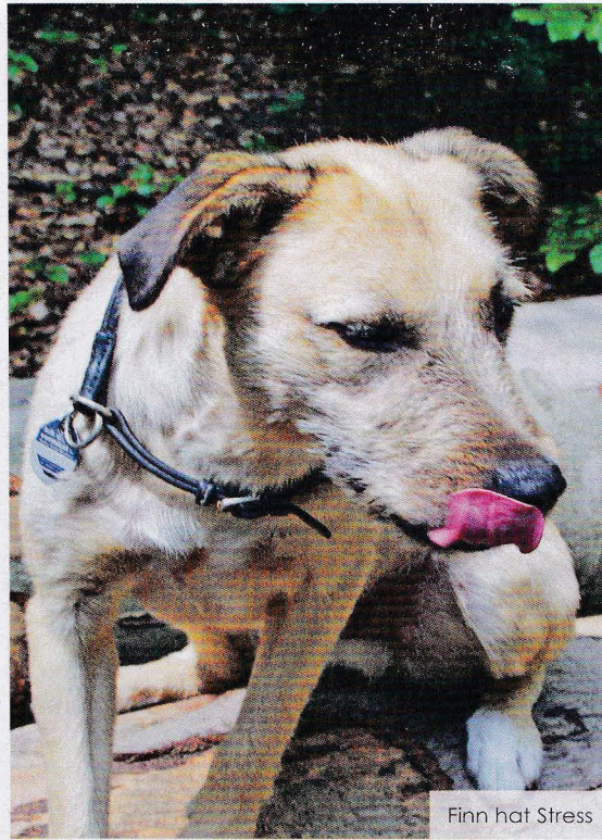
Finn hat Stress

Ich kann meinem Hund bei Begegnungen helfen, besonders, wenn er an der Leine ist: Ich führe ihn nicht direkt auf einen Hund zu, sondern gehe einen Bogen und nehme ihn an meine von dem anderen Hund abgewandte Körperseite. Wenn wir vorbeigehen, reicht beim geschützten Hund ein „Lass es!“, um ruhig zu bleiben, auch wenn der andere pampst. Das Befindlichkeitssignal an meinen Hund: Ich bin gelassen, vertrau dich mir an. Hunde brauchen Regeln und Rituale, bei denen sie wissen, woran sie sind. Das geht uns im Berufsleben nicht anders. Haben wir einen kompetenten Chef, der weiß, wie er seine Mitarbeiter zu führen hat, fühlen wir uns wertgeschätzt und werden nicht die Firma verlassen. Wenn der Hund viele Befindlichkeitssignale einsetzt, möchte er uns damit etwas mitteilen. Nicht immer erschließt sich uns der Grund, obwohl alle Handlungen unseres Hundes einen Sinn haben. Meistens wirkt ein ausgelassenes Spiel schon entspannend. Wenn der Hund sich schüttelt, ist seine Befindlichkeit: Es ist alles wieder gut! Mein Hund Shadow blafft mich an, wenn er eine Übung nicht versteht: „Überarbeite mal gefälligst deinen Lehrplan!“ Befindlichkeit: Ich verstehe nix! Ich habe von ihm gelernt, für ihn nachvollziehbare Signale und Bewegungen zu machen. Ich rede nur das Nötige, bleibe freundlich und spiele viel mit ihm. Das vertreibt negative Signale bzw. Empfindungen. Nur sein zufriedenes Lächeln bleibt – zu mir nach oben und an meiner Seite – das ist das schönste Befindlichkeitssignal überhaupt!