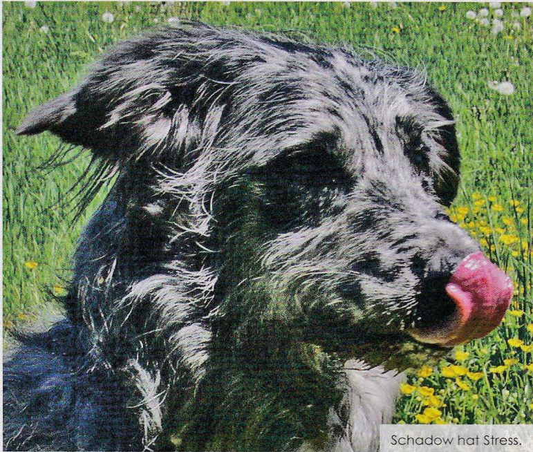
Shadow hat Stress.